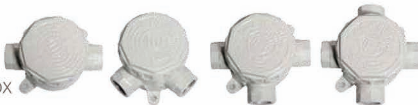
2 ทางตรงข้าม